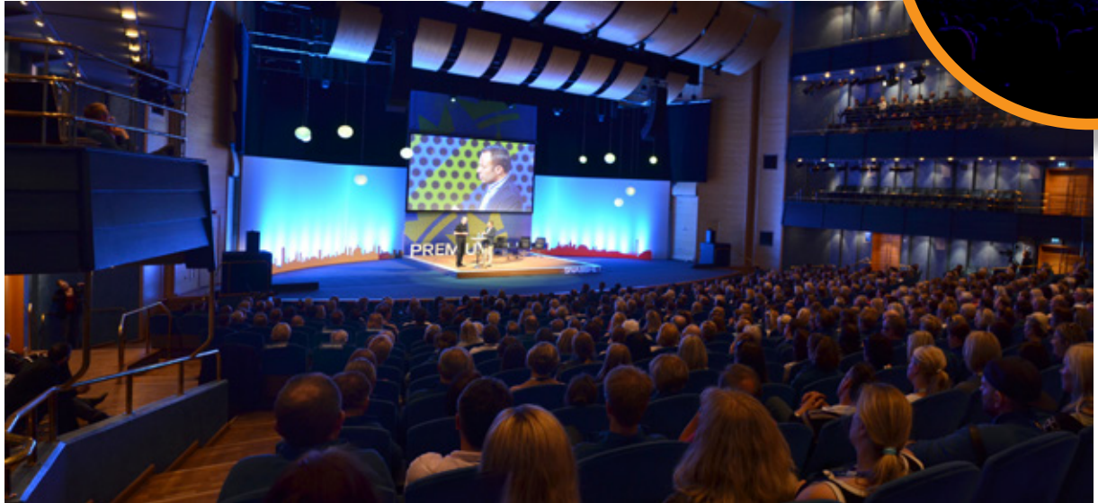
Stor scenyta öppen för kreativa lösningar