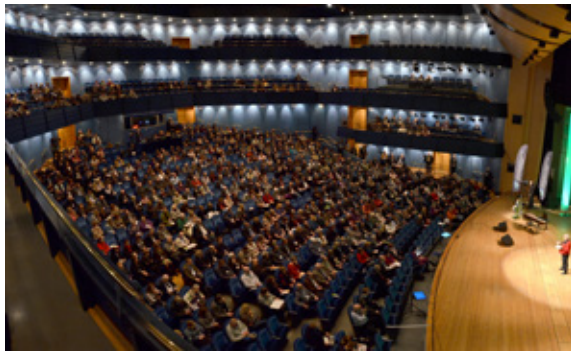
Lokalen bygger på höjden vilket ger närhet till scenen