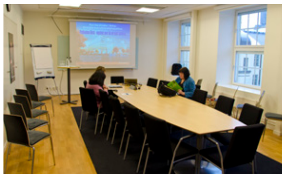
Konferensrum 5 har styrelsesittning för lite intimare möten.

Vår konferensvåning lever verkligen upp till kraven på flexibilitet. En härlig lounge och åtta toppmoderna konferensrum med flyttbara väggar bäddar för att du ska hitta just de möteslokaler du söker.