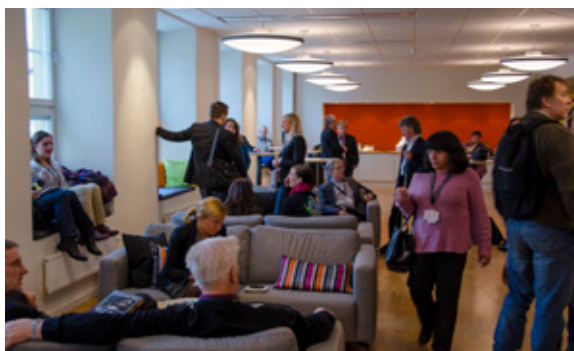
I anslutning till konferensrummen finns en lounge.