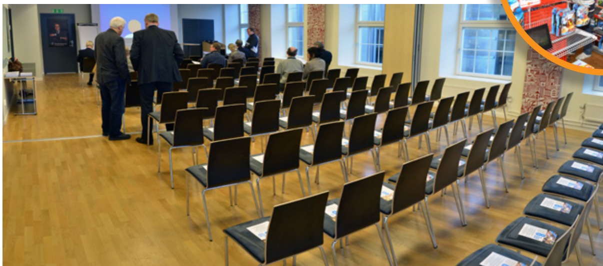
Moderna, avdelbara, välutrustade konferensrum